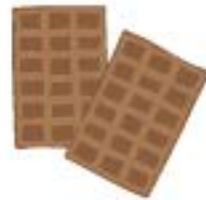
2 Tafeln Schoggi